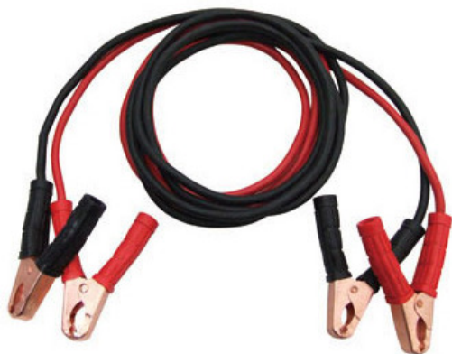
ブースターケーブルの選び方(目安表)