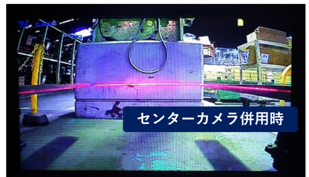
センターカメラ併用時

オプションの各種カメラ、モニターとの組み合わせで、更に視認性が向上し事故を抑止します。全てワイヤレスかつモバイルバッテリー駆動が可能なので、誰でも取付簡単！