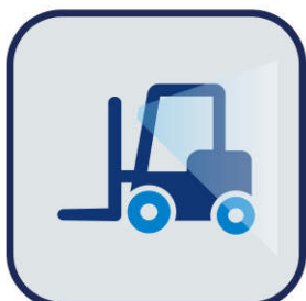
カメラからの映像入力